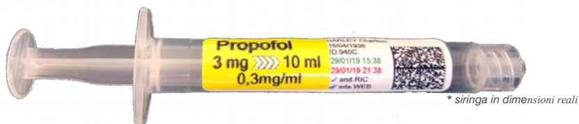
* siringa in dimensioni reali

La misura (50x14 mm) è stata concepita per permettere l'applicazione dell'etichetta anche sulle siringhe più piccole senza coprire l'indice graduato garantendo allo stesso tempo una leggibilità assoluta (anche sulle sacche più grandi).